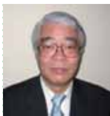
講座担当 コーディネーター